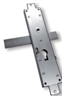
Serrure 3 points zinguée blanc