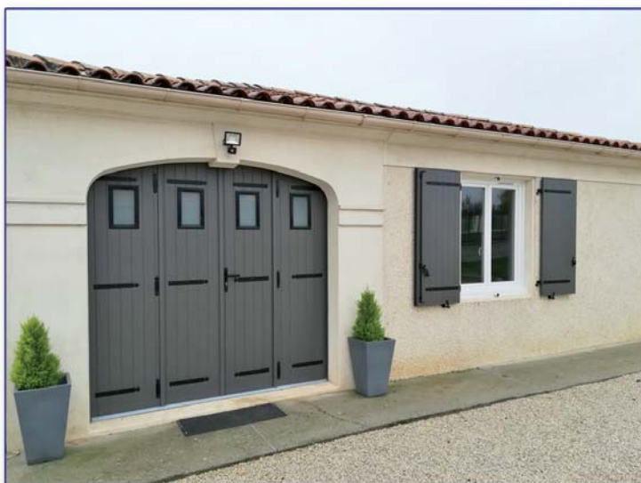
Porte de garage repliable 4 vantaux Aluminium isolé double mouchette avec hublots