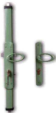
Serrure carénage alu 3 points + béquille + plaque