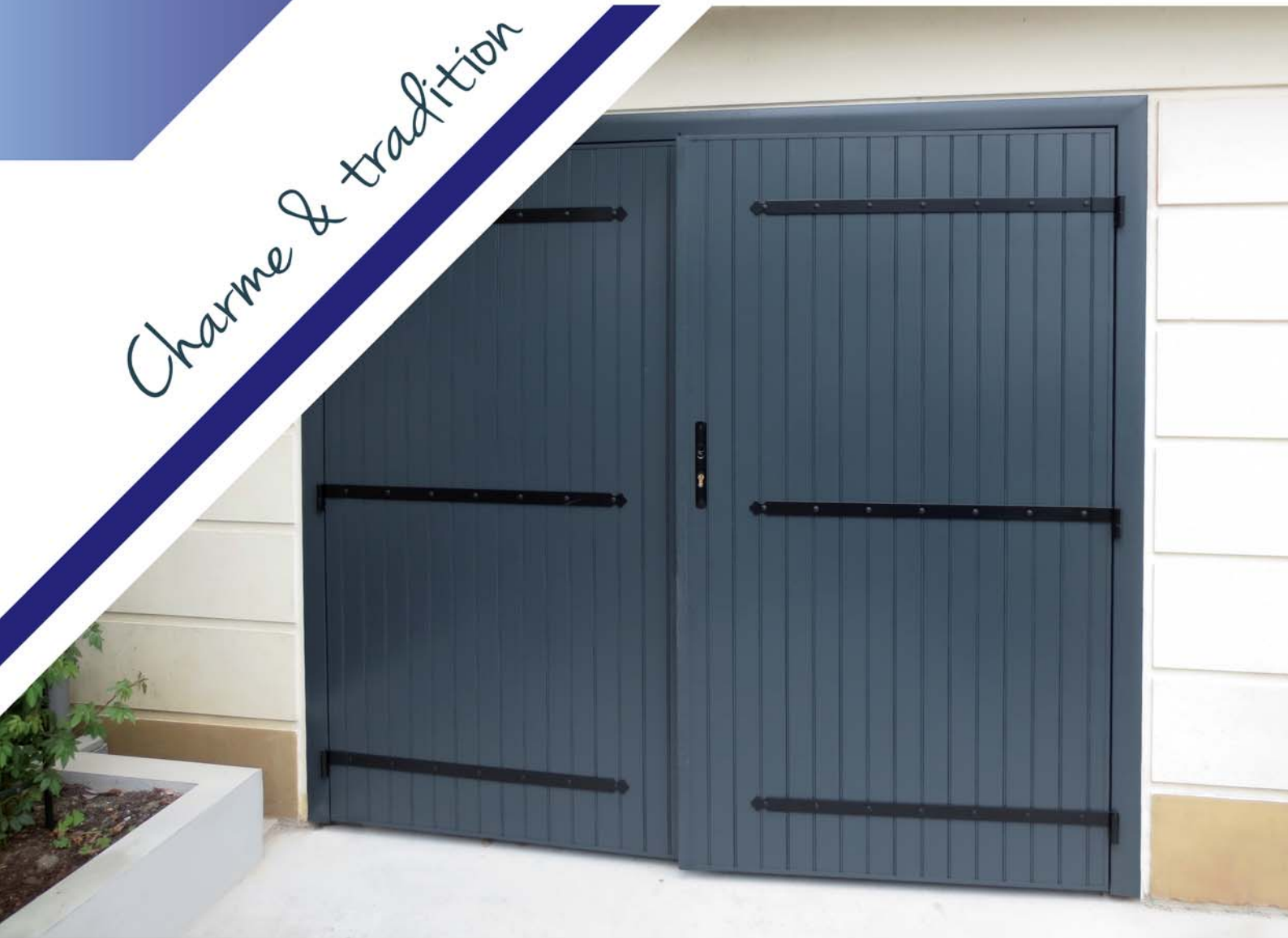
Porte de garage battante 2 vantaux Aluminium extrudé + pré-cadre