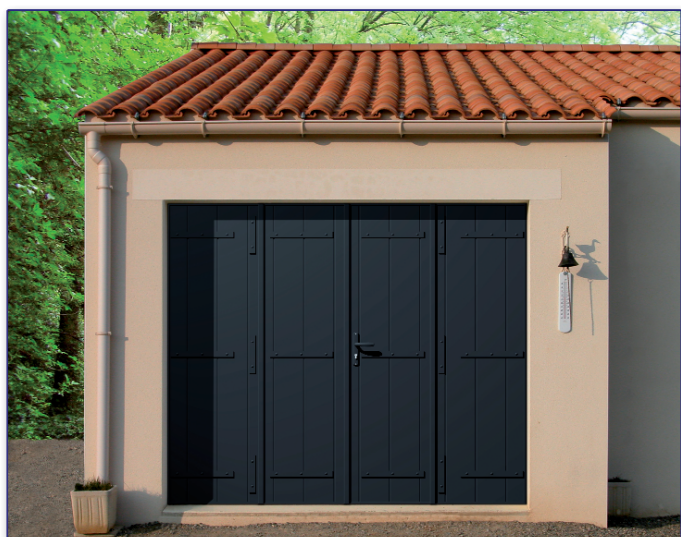
Porte de garage repliable 4 vantaux Aluminium isolé simple nervure