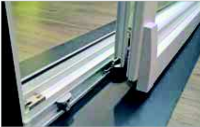
Roulements adaptés au poids du double et triple vitrage.