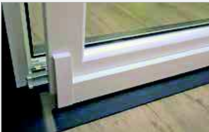
Renvoi automatique du vantail lors de la fermeture.