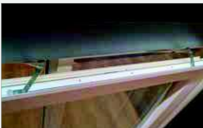
Double compas pour une sécurité maximale.